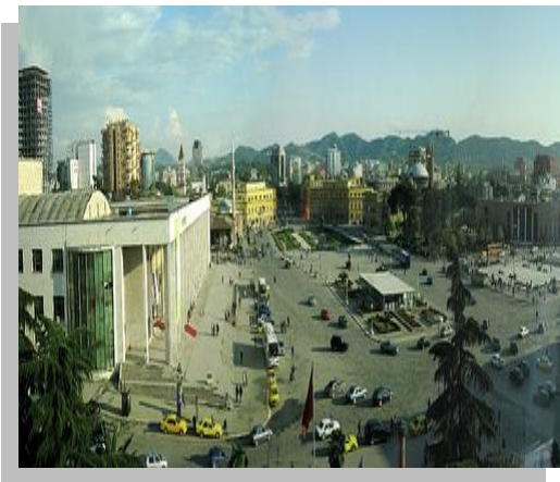
- Площадь Скандербега