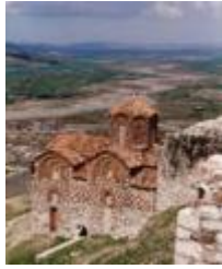
Собор Святой Троицы