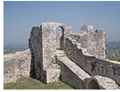
В крепости Берат