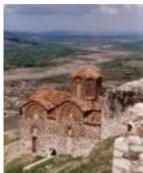
Собор Святой Троицы